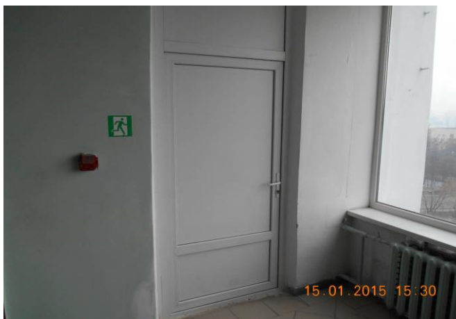
Рис. 13.3. Виконані роботи по ремонту, заміні, утепленню дверей в холах на поверхах ІЛК та евакуаційних виходах