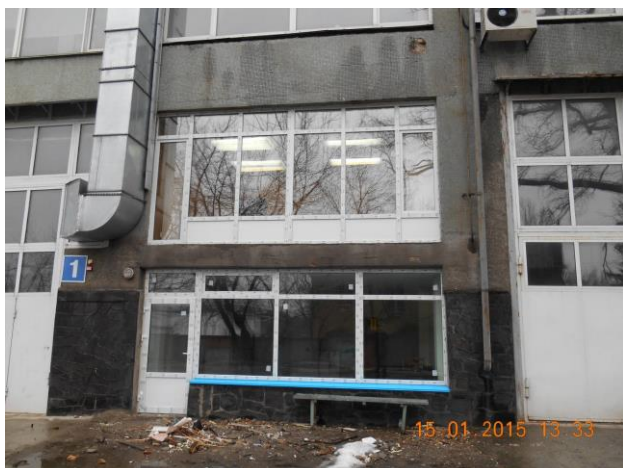
Рис. 13.7. Проведено заміну старих дерев'яних вікон на металопластикові енергозберігаючі в приміщеннях 1, 2 поверхів двоповерхової лабораторної прибудови (операторська боксу випробовування автомобілів за їздовими циклами за стандартами ЄС та офісне приміщення персоналу випробувального центру)