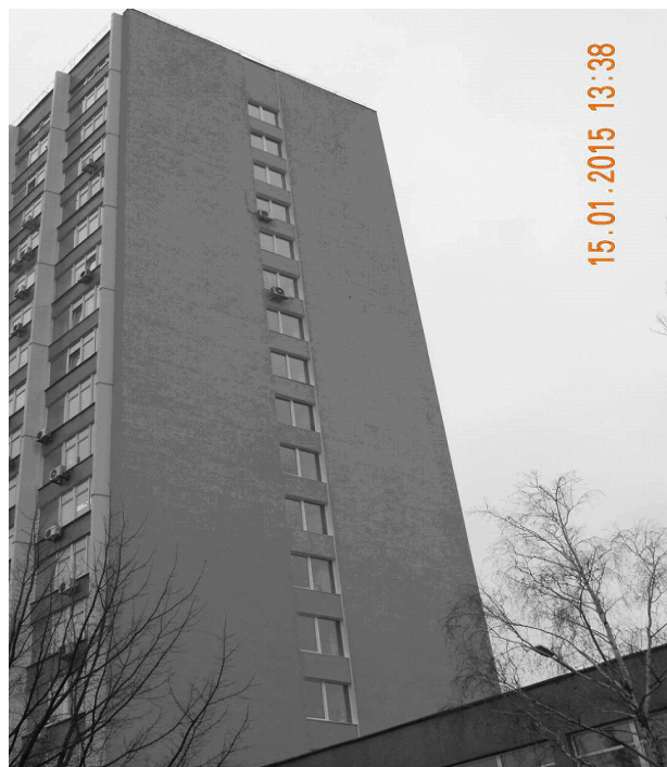
Рис. 13.12. Проведено утеплення західної торцевої стіни будівлі ІЛК підприємства