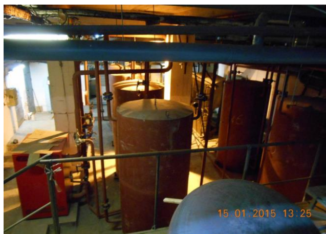
Рис. 13.1. Модернізація системи опалення будівлі підприємства (котли)

Проведення цих заходів дозволило ДП «ДержавтотрансНДІпроект» вже в 2014 році зменшити витрати споживання природного газу на 14,8 % у порівнянні з аналогічним періодом 2013 року.