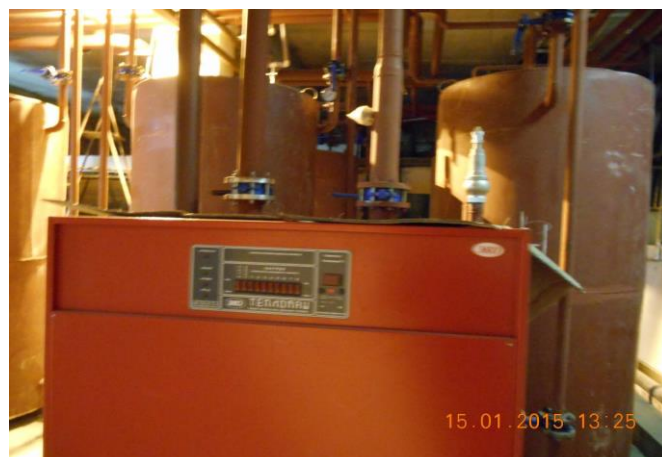
Рис. 13.2. Модернізація системи опалення будівлі підприємства (система управління)