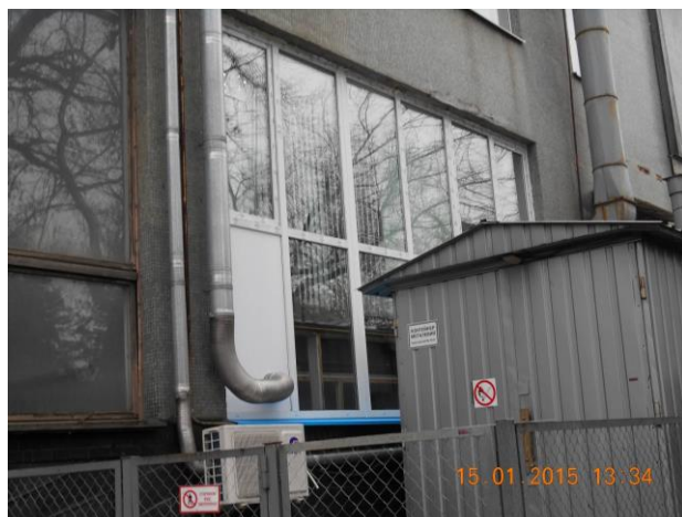
Рис. 13.8. Проведено заміну старих дерев'яних вікон на металопластикові енергозберігаючі в приміщеннях 1, 2 поверхів двоповерхової лабораторної прибудови (приміщення газоаналітичного комплексу та офісні приміщення персоналу випробувального центру)