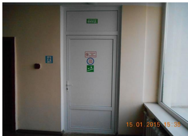
Рис. 13.4. Виконані роботи по ремонту, заміні, утепленню дверей в холах на поверхах ІЛК та евакуаційних виходах