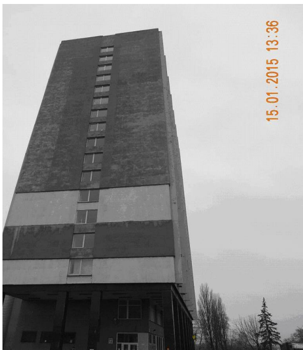
Рис. 13.11. Проведено утеплення східної торцевої стіни будівлі ІЛК підприємства