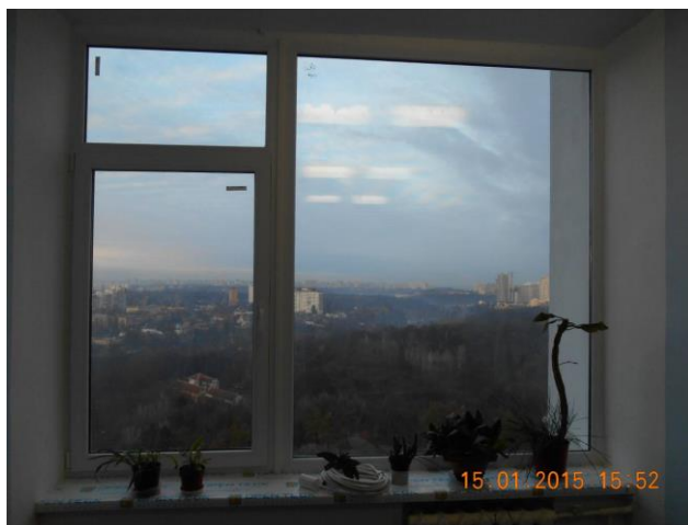
Рис. 13.9. Проведено заміну старих дерев'яних вікон на металопластикові енергозберігаючі в приміщеннях 17 поверху висотної частини будівлі