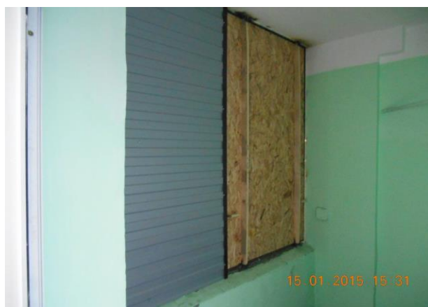
Рис. 13.6. Проведено ремонт, утеплення віконних проїмів допоміжних приміщень підприємства