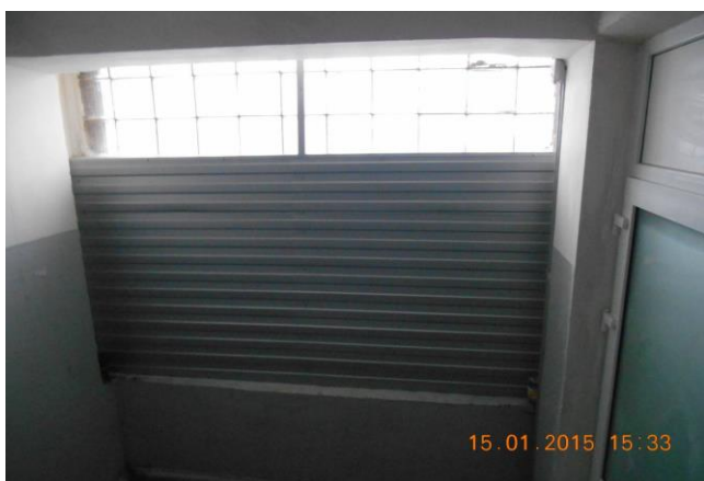
Рис. 13.5. Проведено ремонт, утеплення проїмів закслених склблоками на еваковиходах та головної сходової клітини